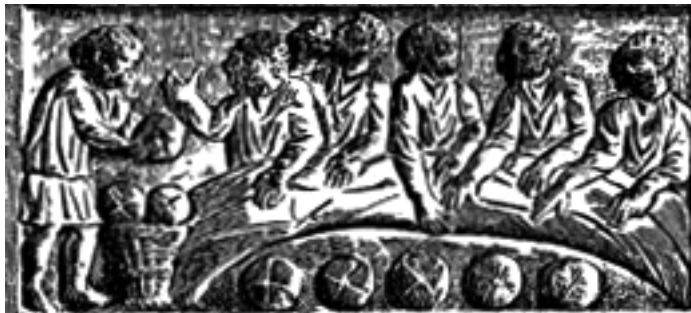
عشای ربانی، کنده کاری روی چوب مربوط به قرون اولیه مسیحیت

چنان که می بینیم از این دوران غالب مسائلی که بعدها برای نسل های مسیحی پیش خواهد آمد مطرح می شود، مسائلی از قبیل: چگونه در دنیایی به سر بریم که مسیحی نیست؟ چگونه زندگی روزمره، زندگی مدنی، سیاسی و اقتصادی را با روح انجیل عجین کنیم؟