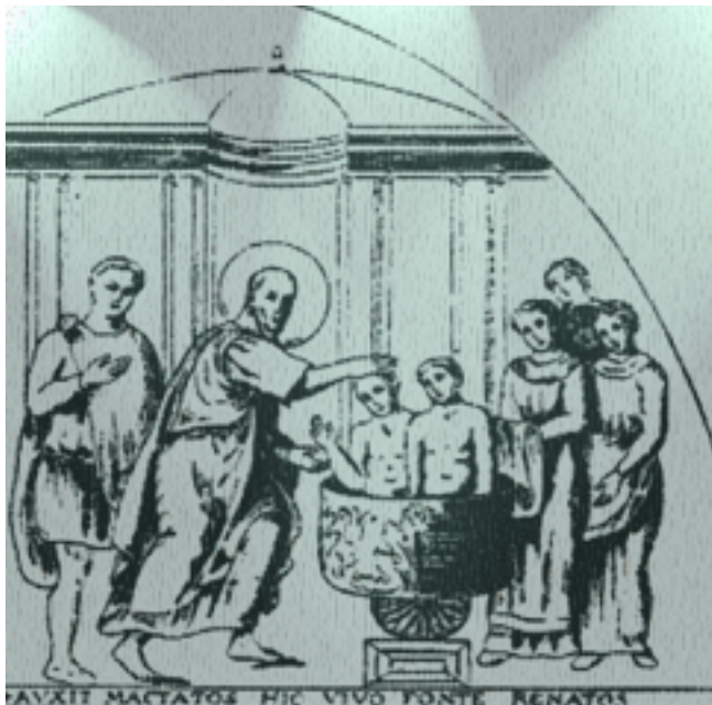
نقاشی قدیمی از حوض تعمید در کلیسای پودانتیان قدیس در شهر اکویلا در شمال شرقی ایتالیا. این شهر در سال ۴۵۲ توسط آتیلا ویران گردید.

از همین دوران، مشکلی در مورد آموزه تعمید مطرح شد که آیا تعمیدی که توسط بدعت گزاران داده می‌شود معتبر است؟ کورنی اسقف رم پاسخ مثبت می‌دهد. سیپریان اسقف کارتاژ بر تجدید آن تأکید دارد. این سؤال هنوز به جواب کامل و نهایی نرسیده و کلیسا در حال جستجوی جواب است.